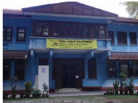
View of MIA Art Centre