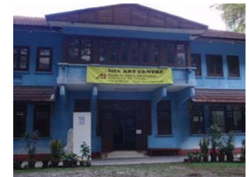
View of MIA Art Centre

rapidKL bus service B103, B105, B114, U21, U22, U26, U28, U29, U30